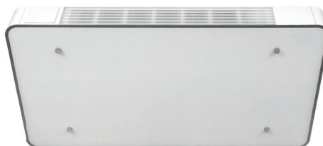
Eplucon FS - convectoren