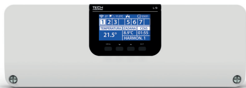
TECH - naregeling