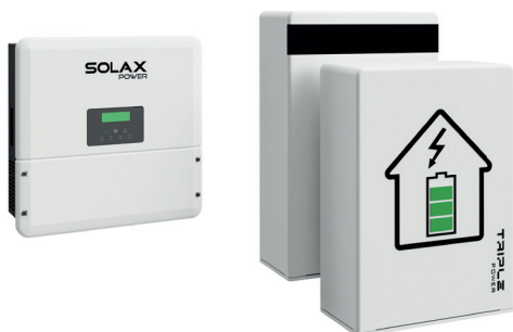
SolaX Power - accupakket